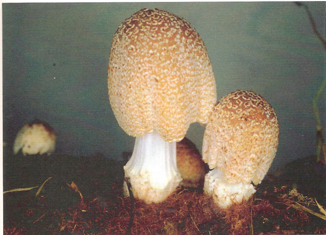
Coprinus ellisii .