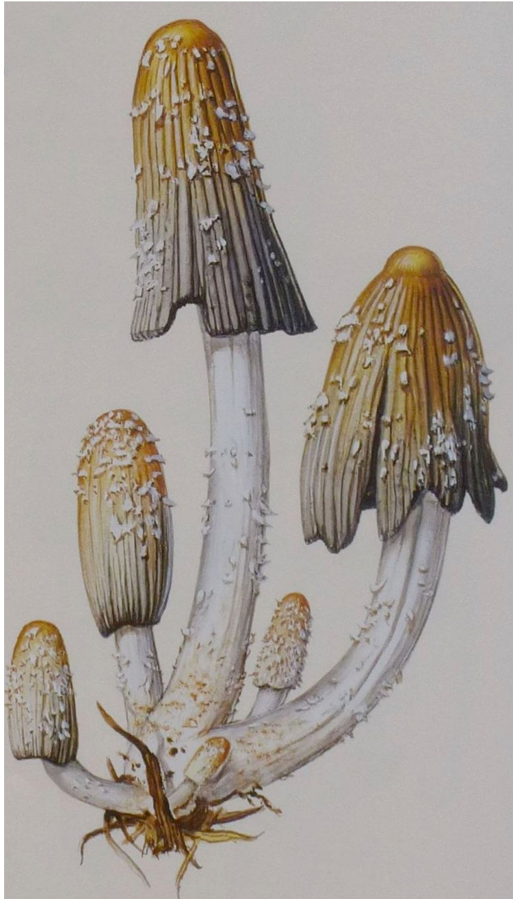
93.59. – Coprinus subcylindrosporus Walzensporiger Mist-Tintling