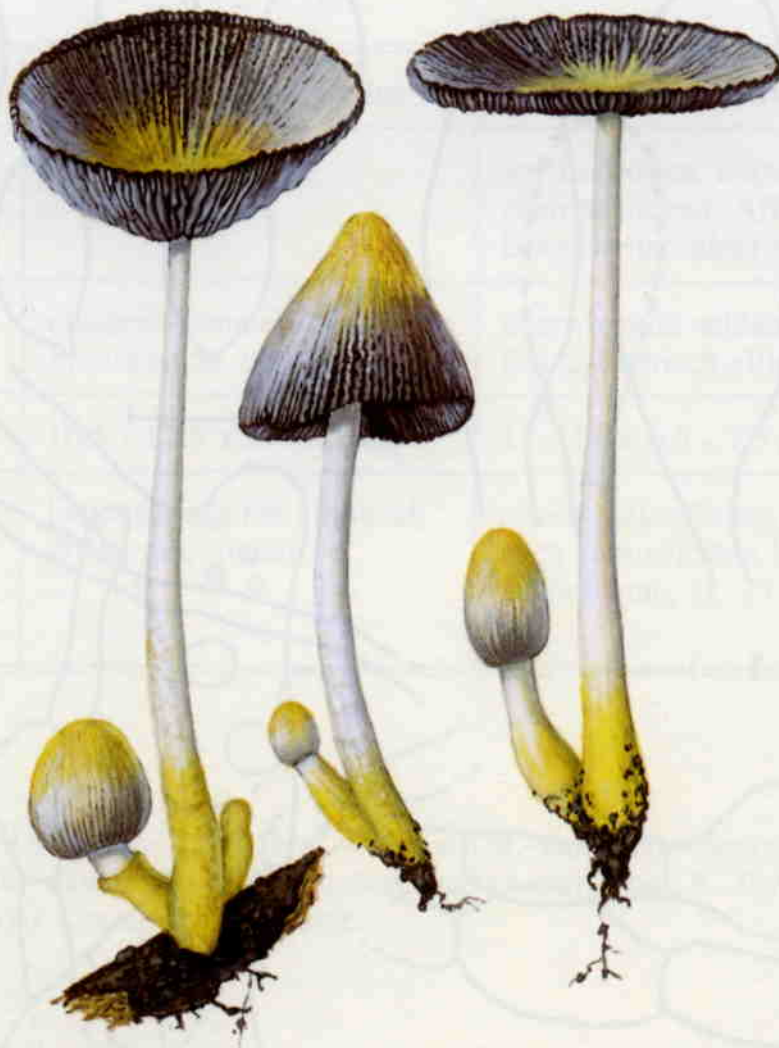
Farbtafel 2: Coprinus citrinovelatus (Aquarell: E. Ludwig)

bis breithalsig-flaschenförmig, blaßgelb; 40 - 110 x 15 - 35 \mu\text{m} . Pleurozystiden vorhanden; ähnlich geformt. HDS zellig, aus bis zu 30 \mu\text{m} breiten Elementen. Velum überwiegend aus zylindrischen, bisweilen etwas unregelmäßigen Elementen; keine Kugelzellen. Schnallen vorhanden.