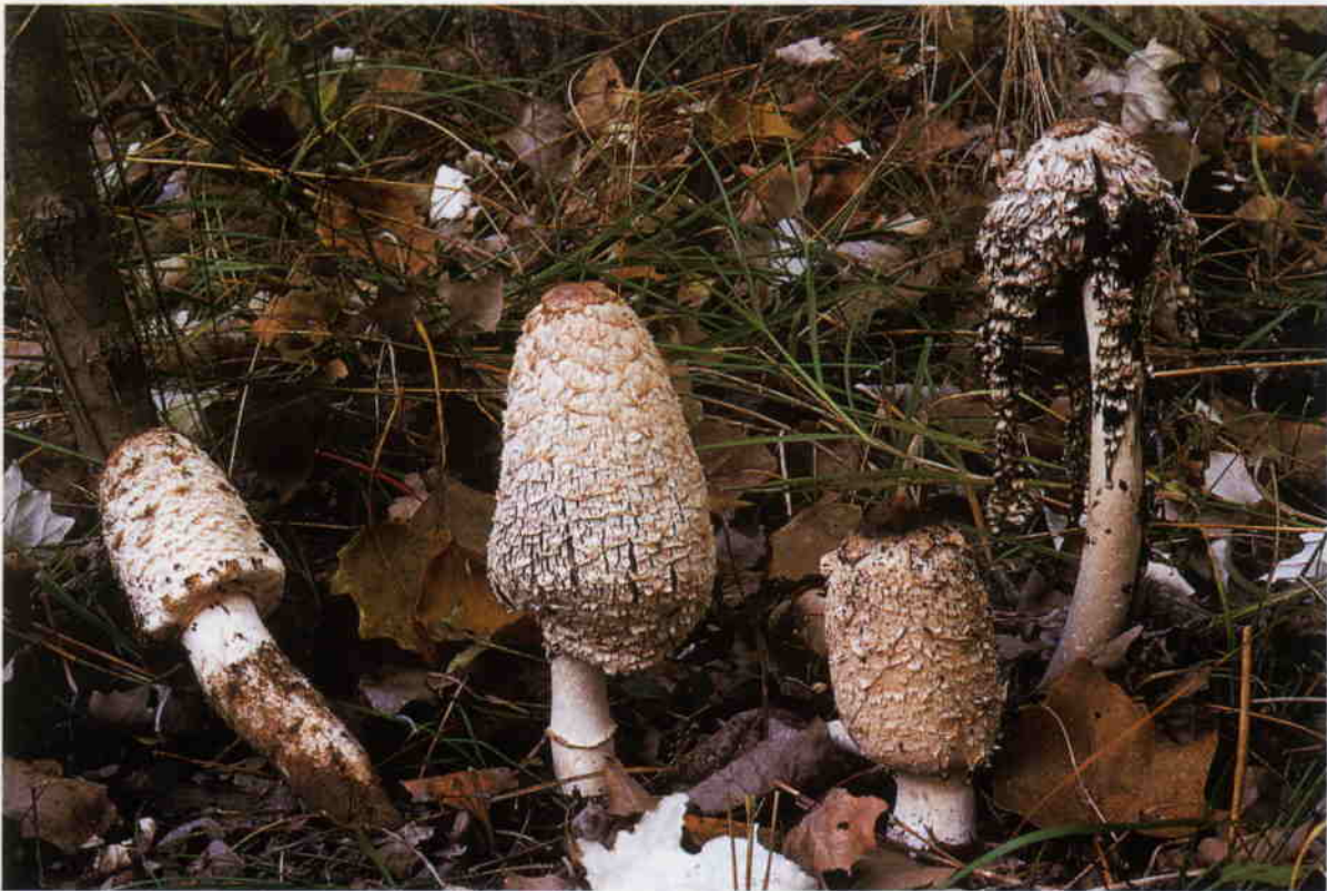
Farbtafel 1: Coprinus levisticolens